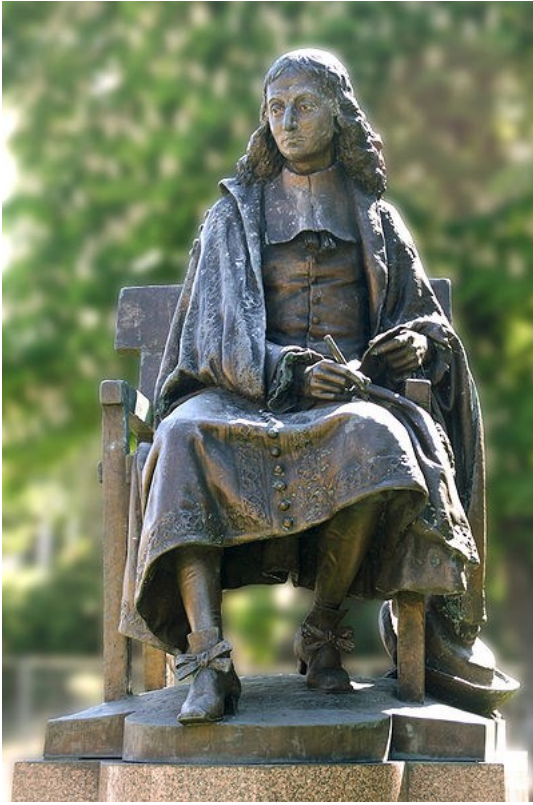
Pascal Eugène Guillaume, 1879 Clermont-Ferrand

aujourd'hui de combiner des données de tout type et de manipuler une quantité de données quasiment infinie, pousse vers des designs basés sur une abondance de données et une analyse basée sur un codage systématique de ces données. Deuxièmement on peut souligner la publication d'ouvrages de méthodes de recherche à l'instar du livre Designing research for publication d'Anne Huff (2009) qui mettent en avant la publication comme principal objectif du processus de recherche. Et finalement les revues elles-mêmes contribuent à la normalisation en explicitant leurs attentes quant aux manuscrits qualitatifs comme, par exemple, à travers la série intitulée Publishing in AMJ au sein de laquelle ses deux éditeurs pour les papiers qualitatifs présentent les caractéristiques des articles de recherche qualitative publiés dans cette revue (Bansal & Corley, 2012).