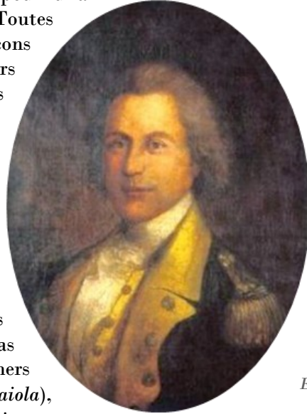
Eugenio dos Santos 1711 – 1760