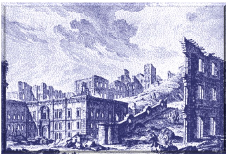
Ruines de la Praça da Patriarcal in Recueil des plus belles ruines de Lisbonne.

Les rues droites et larges se coupant à angle droit, les immeubles standardisés fondés sur des principes de construction plus scientifiques développant des normes antisismiques, l'articulation des deux grandes places, créent une cité nouvelle, même si, sur le Rossio, le palais de l'Inquisition est reconstruit (Pombal videra celle-ci de sa substance et la neutralisera) 6 ; même si le nom des anciennes rues est conservé et les artisans regroupés comme ils l'étaient : les orfèvres de l'or et de l'argent, les cordonniers, les doreurs ( rua dos douradores ). Londres avait été repensée après le grand incendie. À Turin, un quartier nouveau avait été juxtaposé à la vieille ville. Rien de comparable n'avait pourtant été tenté. Le projet prend plus de vingt ans, mais les témoins hébétés du tremblement de terre partageaient l'idée que de cent ans