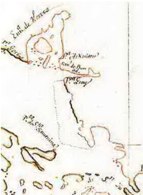
Carte dressée par Juan Francisco de la Bodega y Quadra après la rencontre avec Vancouver. Les contours marron sont ceux relevés par les navires espagnols et les contours en rouge sont ceux relevés par Vancouver

Pendant la traversée, Vancouver s'enferme dans sa cabine, des heures durant, face à ses cartes. Elles marquent la passe de de Fuca et celle de de Fonte, complétées des relevés opérés par Cook, mélange de réel plus ou moins précis et de vides comblés sur la foi de récits imaginaires. L'une d'entre elles vient de John Meares. Elle se démarque des autres par une étrangeté. Il y est en effet indiqué qu'un navire américain, le Washington , serait entré dans une passe, au sud des îles Queen Charlotte, pour ressortir plus bas dans l'océan par la passe de de Fuca.