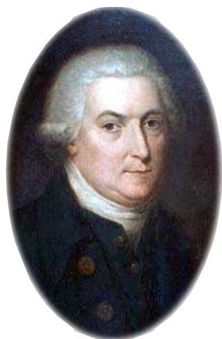
George Vancouver 1757 - 1798

suivi cette vallée, le 23 mai 1887, à 12h46, la locomotive 374 de la Canadian Pacific Railways entra en gare de Vancouver. Parti de Montréal, le convoi avait mis 5 jours, 18 heures et 46 minutes pour traverser le continent. Le passage du nord-ouest s'ouvrait enfin, provoquant l'essor de la ville qui portait son nom, dans cette baie qui lui avait semblé si effrayante de désolation lorsqu'il y avait pénétré ■