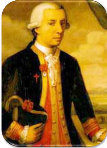
Juan Francisco de la Bodega y Quadra 1743 - 1794

Insensiblement tout d'abord, plus nettement vers la fin du voyage, la santé de Vancouver avait décliné. Sans doute était-il atteint de tuberculose, peut-être avec des complications neurologiques. Même au regard des mœurs maritimes de ce temps, et de celles particulièrement dures de la Royal Navy, il commandait avec morgue. Fait rarissime dans l'histoire de la marine de guerre anglaise, il fit un jour fouetter un officier d'origine noble, Thomas Pitt, futur baron de Camelford. Vancouver n'avait vécu, depuis l'âge de quinze ans, que sur un navire de guerre. Il n'avait connu d'autres femmes que ses sœurs. Commandant en chef, il n'avait pu nouer aucun lien affectif avec ses officiers. Il vénérât le capitaine qui l'avait formé, qu'il avait vu mourir assassiné, et dont il avait rétabli la réputation. Le seul être avec qui quelque chose de ressemblant à une amitié s'était noué avait disparu en mars 1794. Encore ne s'étaient-ils jamais adressés directement la parole, ignorant chacun la langue de l'autre.