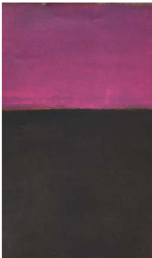
Rothko Chapel, Houston (1964)

envoyé », à la direction prise : quand on dit « je promets », cela engage le cours de l'action, la valeur de vérité, les conditions de félicité ou d'infélicité. On fait attention aux catégories (par exemple, écouter un discours juridique avec une tonalité morale). Il faut partir des erreurs de catégories pour repérer l'ensemble des embranchements, où l'on juge, par erreur, des catégories.