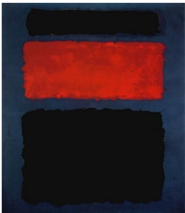
Untitled, Rothko (1960)

Modernes (le droit, le religieux, le politique, l'économique, l'organisationnel, etc.) coïncident finalement avec les modes d'existence est sans doute inévitable mais me fait problème : le projet ne bouscule finalement pas les frontières. Malgré ce qu'il en dit, affirmant que ces frontières des domaines ne tiennent pas (il y a du droit dans l'économie, du politique dans la science, etc.), il les renforce in fine paradoxalement en ajoutant simplement des modes d'existence transverses, si l'on peut dire, comme l'habitude. Autrement dit, une fois une meilleure connaissance établie, tout semble rester en l'état en pratique, à l'exception de la politique. Mais cette meilleure connaissance, à la différence de ce qui se passe chez Wittgenstein, ne semble pas même permettre d'éviter des erreurs. À l'exception du politique, encore une fois, qui, lui, appelle un changement. La difficulté gît en partie d'ailleurs dans le dispositif d'écriture du livre, particulièrement complexe. Il y a un « je », pas très fréquent mais réel, dont on peut penser qu'il représente Bruno Latour ; il y a un être de fiction, une ethnologue, qui mène