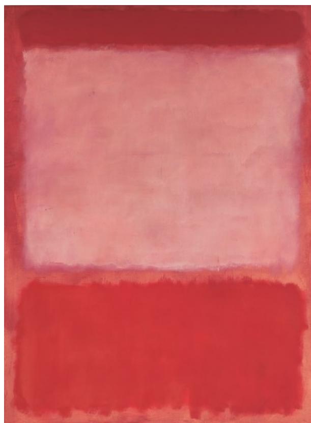
n° 16, Rothko (1960)

Bruno Latour : Cela me paraît toujours très bizarre qu'un auteur veuille être original. Les auteurs se cumulent par le fait qu'on les utilise et qu'on les pille. Mais Weber n'est peut-être pas au fait des questions écologiques, ce n'est pas son siècle ■