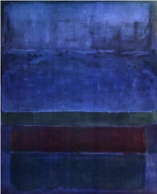
Blue, Green and Brown, Rothko (1951)

que la musique n'est rien, puisqu'elle ne répond pas à la condition de félicité de cet autre mode d'existence qu'est celui de la science, c'est-à-dire la preuve. Tu vois dans cet exemple qu'il existe des modes d'existence multiples et distincts (ici au moins deux, l'œuvre d'art et le raisonnement scientifique), qu'ils ont chacun des conditions de félicité et d'infélicité – l'extase pour l'œuvre d'art, la preuve réussie pour la science – et que l'on peut se tromper en appliquant à un de ces modes d'existence une approche qui relève d'un autre. Poussons plus loin, car l'anecdote d'Hoffmann est riche : la thèse de Bruno Latour est que la modernité se caractérise par la survalorisation d'un mode d'existence, celui de la science, qui a eu tendance à écraser les autres. La modernité tout entière a « cet air fin » que décrit Hoffmann : la science regarde la politique, la religion, la fiction, le droit, l'économie, de haut, en leur demandant des comptes sur leur fonctionnement de son propre point de vue. Bruno Latour avance encore en posant que la science en question n'est pas celle qui se fait, mais une fausse conception de la science. Là, je reconnais que ça se complique un peu. Il faut donc reprendre la description du fonctionnement de la science pour la réajuster, et décrire les autres modes d'existence en leur conférant une égale dignité (p. 95).