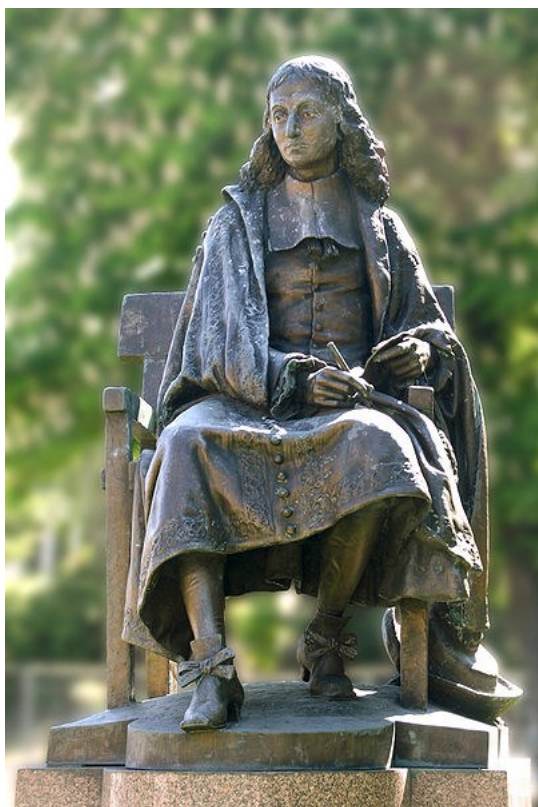
Pascal Eugène Guillaume, 1879 Clermont-Ferrand

aujourd'hui de combiner des données de tout type et de manipuler une quantité de données quasiment infinie, pousse vers des designs basés sur une abondance de données et une analyse basée sur un codage systématique de ces données. Deuxièmement on peut souligner la publication d'ouvrages de méthodes de recherche à l'instar du livre Designing research for publication d'Anne Huff (2009) qui mettent en avant la publication comme principal objectif du processus de recherche. Et finalement les revues elles-mêmes contribuent à la normalisation en explicitant leurs attentes quant aux manuscrits qualitatifs comme, par exemple, à travers la série intitulée Publishing in AMJ au sein de laquelle ses deux éditeurs pour les papiers qualitatifs présentent les caractéristiques des articles de recherche qualitative publiés dans cette revue (Bansal & Corley, 2012).