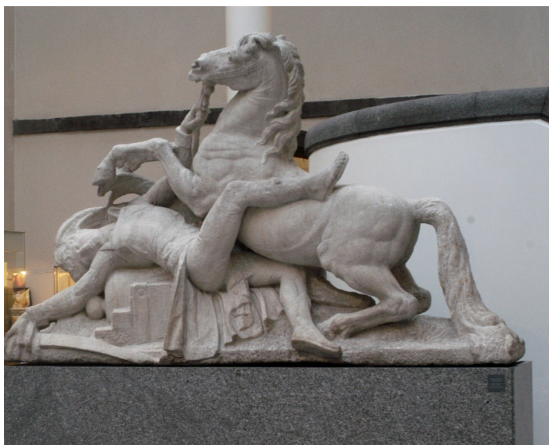
La mort du Maréchal Desaix Joseph Chinard (1801) Musée Roger Quilliot

Whyte William Foote (1984) Learning from the field: a Guide from Experience , Thousand Oaks (CA), Sage ■