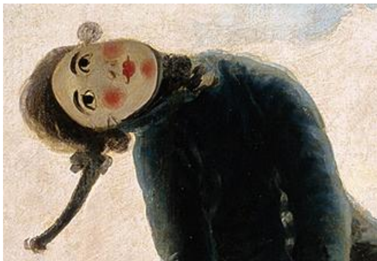
Le pantin – détail, Francisco de Goya (1792)

au moment où il acquiert la nationalité américaine, qu'il prend le nom d'Erikson (le fils d'Erik).